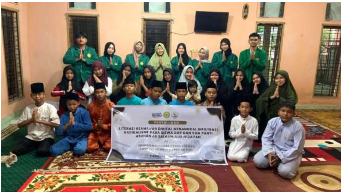
Gambar 1. Pelaksanaan kegiatan sosialisasi

Perubahan sosial yang terjadi selama kegiatan dapat diamati dari respons peserta. Pada awal sesi, peserta cenderung hanya menerima informasi. Namun, seiring berjalannya sosialisasi, terjadi peningkatan antusiasme di mana peserta mulai berani mengemukakan pendapat mengenai pengalaman mereka berselancar di internet. Hal ini menunjukkan adanya pematik kesadaran awal ( awareness ) mengenai bahaya di ruang digital.